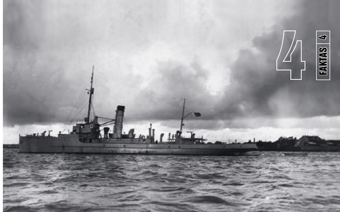
Lietuvos laivyno laivas „Prezidentas Smetona“ Klaipėdos uoste. Klaipėda, XX a. 4 deš.

1923 m. Lietuvai susigrąžinus Klaipėdos kraštą, ilgą laiką Lietuvos jūros pakrantę saugojo paprasti laivai „Savanoris“, „Lietuvaitė“ ir „Šaulys.“ O 1935 m. įsteigus Lietuvos karinį jūrų laivyną, iš Vokietijos buvo įsigytas pirmasis karo laivas ir pavadintas „Prezidentu Smetona“. Šis laivas tapo viso Lietuvos karo laivyno pagrindu, taip pat buvo naudojamas kaip mokomasis laivas.