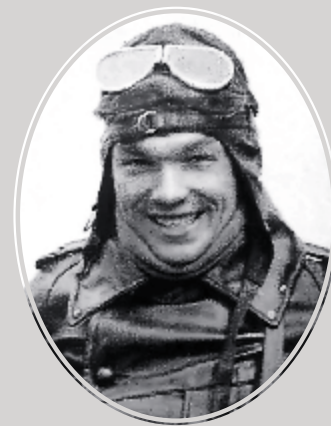
Karo lakūnas, aviacijos kapitonas Romualdas Marcinkus (1907–1944)

Kapitonas Romualdas Marcinkus – tragiško likimo neeilinė asmenybė. Tarnavo Lietuvos karo aviacijoje, buvo lakūnas ir parašiu-tininkas – testuodavo naujus parašiu-tus. Antrojo pasaulinio karo metu buvo priverstas pasitraukti iš Lietuvos. Iš pradžių likimas nubloškė į Prancūzijos, o vėliau į Didžiosios Britanijos karines oro pajėgas. Lakūnas aktyviai dalyvavo oro mūšiuose prieš Vokietiją. Tačiau vieno mūšio metu Romualdo pilotuojamas lėktuvas „Hurricane“ (liet. „Uraganas“) buvo numuštas ir lakūnas papuolė į vokiečių nelaisvę. 1944 m., mėgindamas pabėgti iš vokiečių lagerio, jis tragiškai žuvo Dancige. Pagal šiuos įvykius 1963 m. buvo sukurtas filmas „Didysis pabėgimas“ (angl. „The Great Escape“).