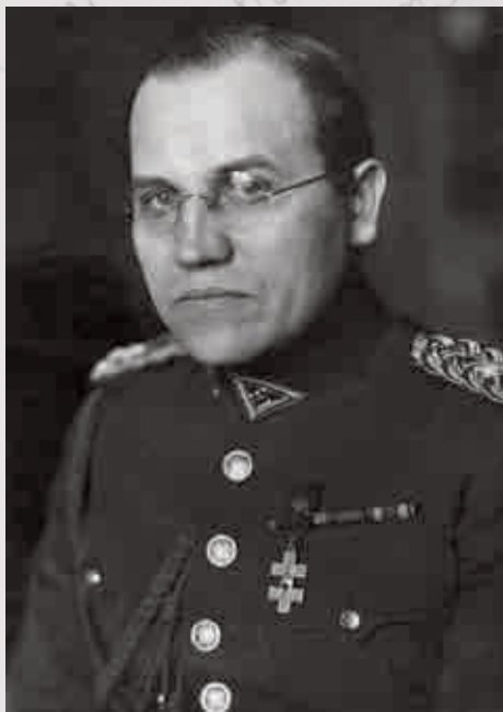
Lietuvos karo atašė Vokietijai gen. št. plk. Kazys Škirpa. Apie 1928–1931 m.

Gen. št. plk. KAZYS ŠKIRPA – karo atašė Vokietijai nuo 1928 m. kovo 13 d. iki 1937 m. liepos 16 d.