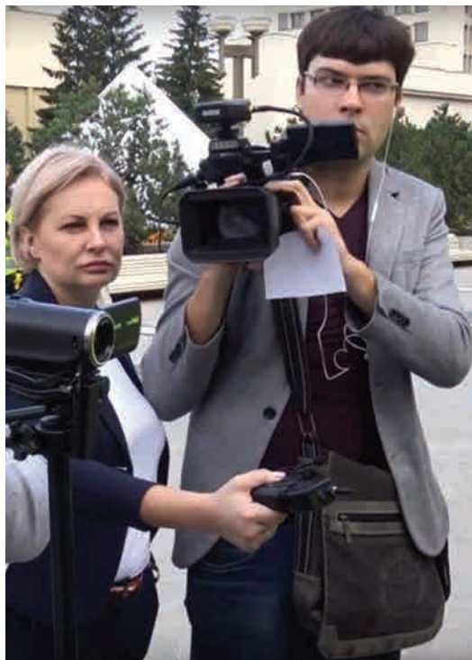
Rusijos propagandistai į Lietuvą rengti reportažų atvyksta slėpdami tikruosius savo vizitų motyvus

Kaip ir tikėtasi, per mokymus „Zapad 2017“ Baltijos šalys ir Lenkija vaizduotos kaip pagrindinės „paranojos“ Rusijos atžvilgiu skleidėjos, taip kuriant skirtį tarp „rusofobiškos“ stovyklos ir nuosaičiųjų Vakarų. Vis dėlto pažymėtina, kad priešiška komunikacinė tema buvo šalutinė. Esminės Rusijos strateginės komunikacijos pastangos buvo sutelktos ne į bauginimą, o į menamą skaidrumą ir atvirumą, taip bandant gerinti santykius su Vakarais.