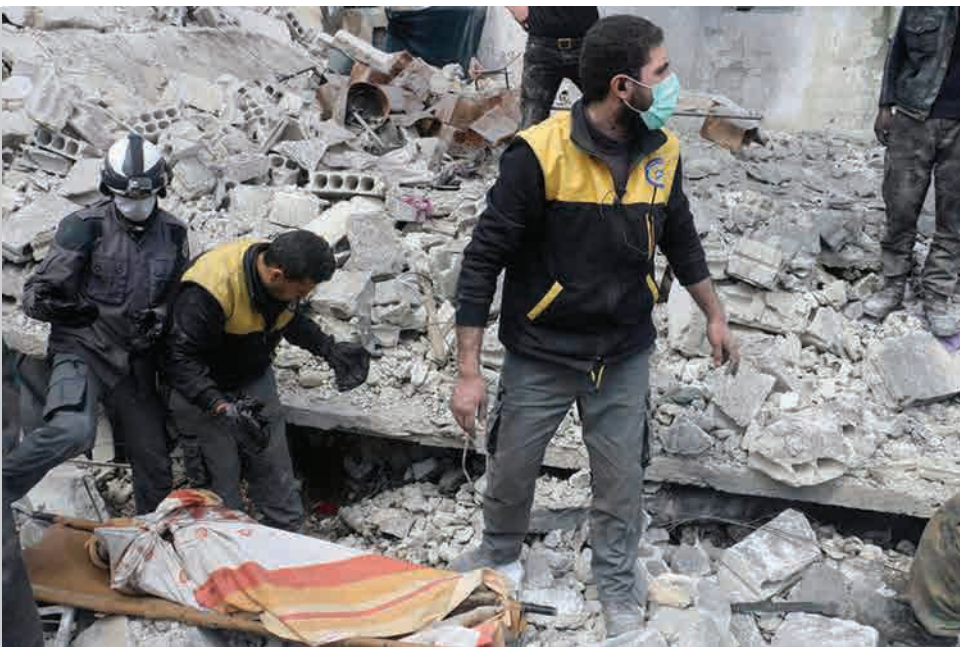
Gelbėjimo darbai Gutoje, Damaskas, Sirija.

2017 m. tęsėsi ISIL nuosmukis Sirijoje ir Irake. Jos kontroliuotas teritorijas Sirijoje puolė tiek vietos kurdų kovotojai, palaikomi JAV, tiek režimo pajėgos, remiamos Rusijos. Irake su ISIL sėkmingai kovojo Irako saugumo pajėgos ir tarptautinė koalicija, vadovaujama JAV. Džihadistai nepajėgė atsilaikyti ir prarado beveik visas turėtas teritorijas, įskaitant svarbiausius miestus – Raką ir Mosulą. ISIL pseudovalstybė („kalifatas“) buvo sunaikinta, o didžioji dalis grupuotės kovotojų buvo priversti trauktis į pogrindį. Šiuo metu ISIL kontroliuoja tik strategiškai nesvarbius teritorijos likučius Sirijoje ir Irake. Grupuotės kovotojų skaičius šiose valstybėse nesiekia 3 tūkst.