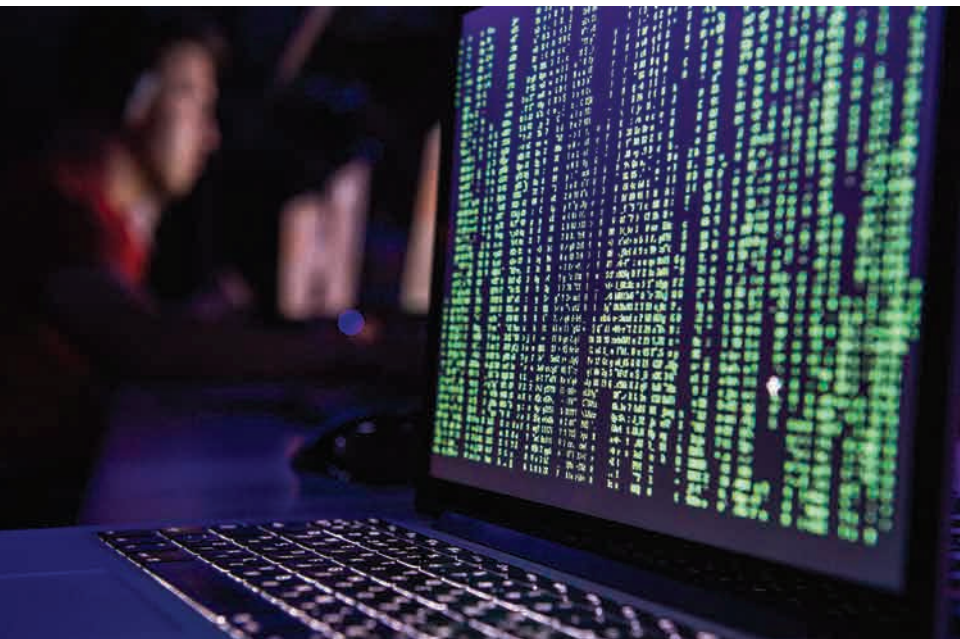
Kibernetinė ataka.

2017 m. JAV paviešino informaciją, kad APT28 / Sofacy 2016 m. įsilaužė į Demokratų partijos rinkimų štabo kompiuterius, taip pat atakavo JAV kompaniją, gaminančią rinkimų balsų skaičiavimo techninę ir programinę įrangą. Grupuotė taip pat įtariama 2017 m. nutekinusi tuometinio kandidato į Prancūzijos prezidentus Emmanuelio Macrono rinkimų kampanijos personalo elektroninius laiškus ir 2017 m. birželį bandžiusi trikdyti Juodkalnijos įstojimo į NATO procesą. Tikėtina, kad