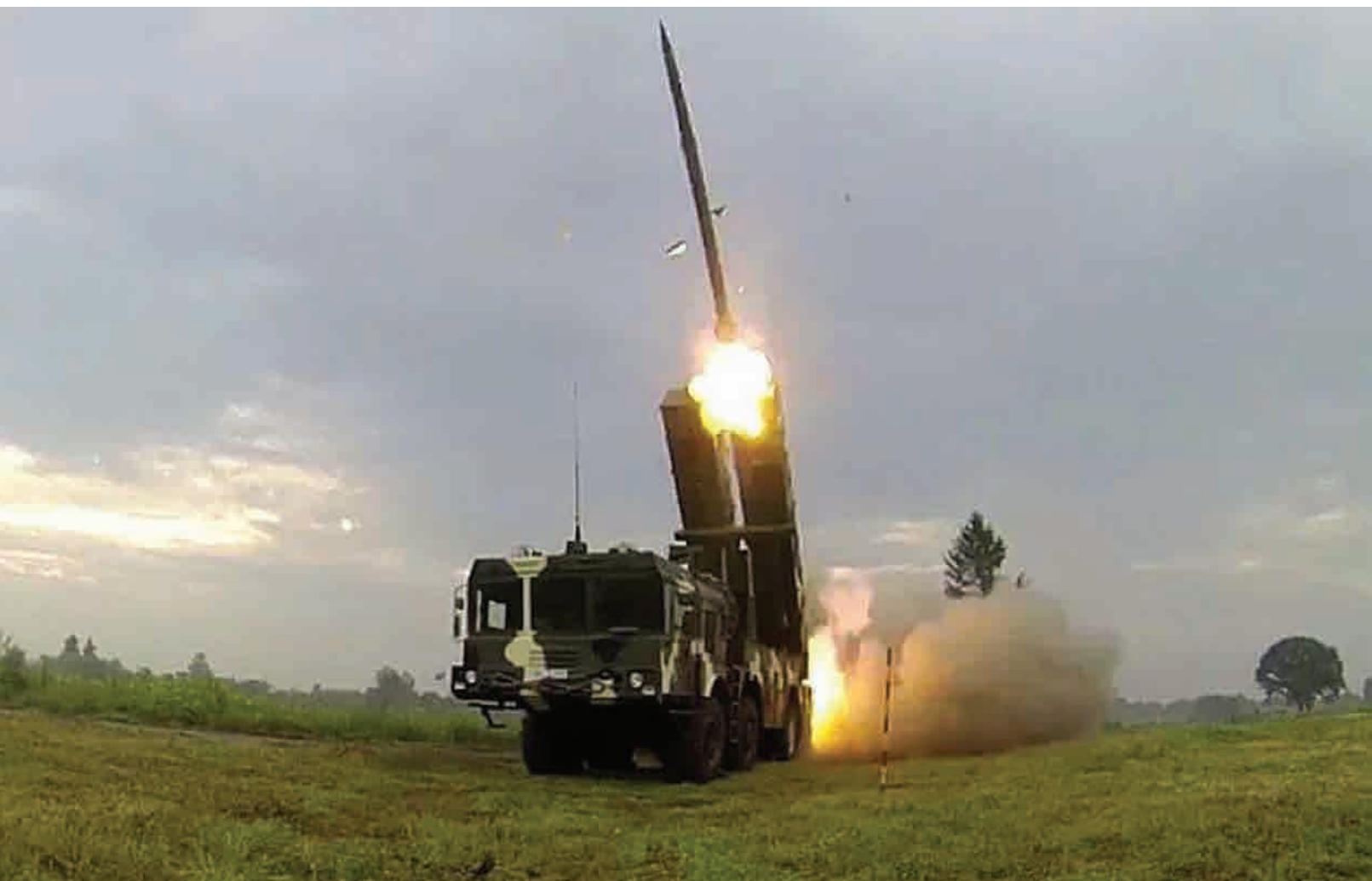
Reaktyvinė salvių ugnies sistema „Polonez“.