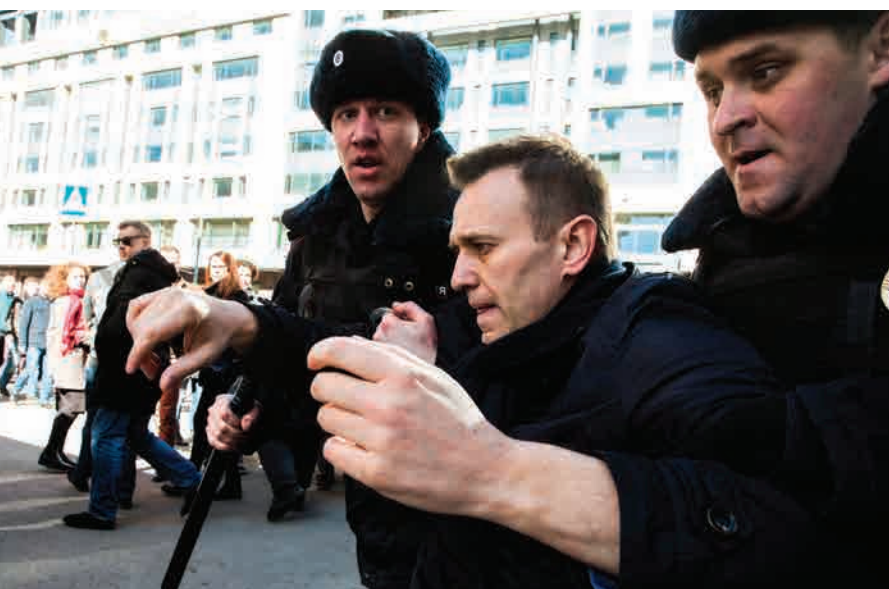
A. Navalno suėmimas per antikorpucinius protestus 2017 m.

cinių protestų banga parodė, kad šalies jaunimas nėra toks politiškai apatiškas kaip vyresnioji karta ir kad jis linkęs reikalauti sisteminių permainų šalies politiniame gyvenime. Jaunoji karta nepriima valdžios kartojamų teiginių apie šalies politinį stabilumą kaip savaiminę vertybę. Tikimybė, kad gyventojų protestai galėtų priversti valdantįjį režimą daryti struktūrines reformas, yra labai nedidelė.