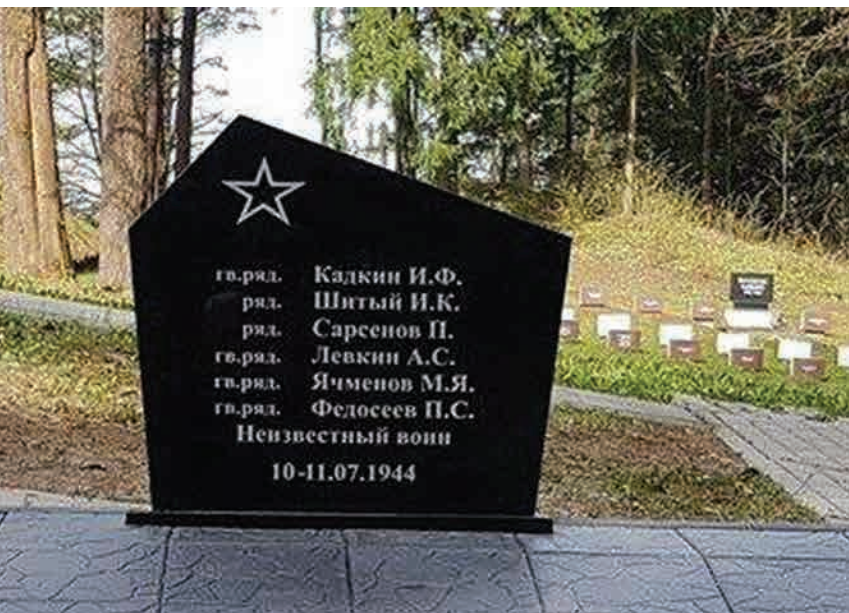
Neteisėtai pastatytas paminklas

Pastaraisiais metais, vykdydama istorijos politiką, Rusija itin daug dėmesio ir lėšų skiria istorinės atminties ir sovietinio paveldo išsaugojimo projektams. Rusija ypač suinteresuota restauruoti karinio paveldo objektus – karių kapus, memorialus, kurie Rusijos pateikiami kaip Lietuvos priklausymo Rusijos geopolitinei erdvei įrodymas. Tokie objektai tampa ir Kremliaus politikos rėmėjų susibūrimo vietomis.