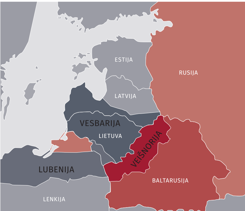
„Zapad 2017“ scenarijus žemėlapio fragmentas

Rusijos karinio planavimo Vakarų kryptimi. Demonstruodama tariamą atvirumą, Baltarusija į mokymus pakvietė tarptautinius stebėtojus, žurnalistus ir akcentavo, kad pagrindiniai mokymų epizodai vyksta jos teritorijoje. Taip buvo siekiama nuslėpti tikrąjį Rusijos teritorijoje vykusių mokymų mastą. Be to, per įvairius su Baltarusijos valdžia susijusius asmenis stengtasi įteigti, kad buvo dveji mokymai „Zapad 2017“: agresyvūs rusiškieji ir „skaidrūs“ baltarusiškieji.