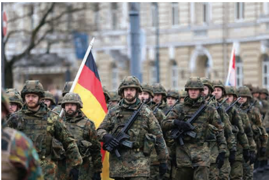
NATO eFP kariai.

2017 m. Rusijos požiūris į Baltijos valstybes išliko priešiškas, o jos politikoje Baltijos regiono atžvilgiu vyravo didėjančių NATO pajėgumų klausimas. Rusija diplomatinėmis ir informacinėmis priemonėmis siekia parodyti, kad Baltijos valstybių ir NATO karinių pajėgumų vystymas didina įtampą ir mažina saugumą Baltijos regione. Karinėmis priemonėmis Rusija rodo, kad ji turi ir bet kuriuo atveju išlaikys karinį dominavimą Baltijos regione, todėl NATO pajėgumų didinimas esą gali sukurti pavojingą įtampos augimo spiralę: į kiekvieną Aljanso veiksmą Rusija atsakys didindama savo pajėgumus ir išlaikys dominavimą regione, o bendra saugumo situacija blogės.