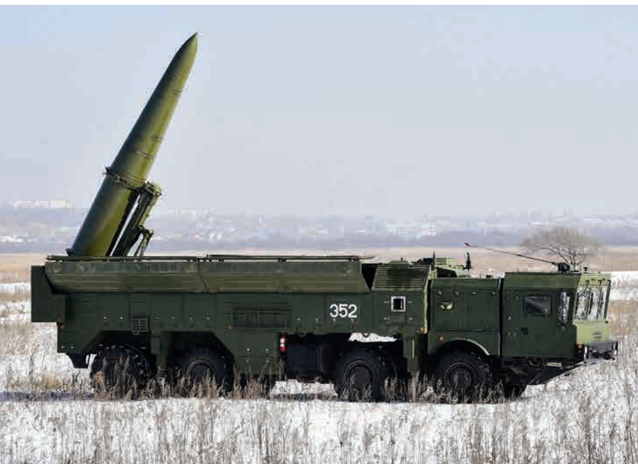
Raketų kompleksas „Iskander-M“.

Rusija toliau stiprina aviacijos ir oro gynybos pajėgumus Kaliningrado srityje. Per praėjusius metus papildomai gauti penki nauji daigafunkciai naikintuvai Su-30SM. 2018 m. srityje dislokuotiems daliniams ketinama perduoti papildomą ilgojo nuotolio zenitinių raketų komplekso S-400 pulko komplektą. Baltijske dislokuoti du laivai, ginkluoti „Kalibr“ raketų sistemomis, gebančiomis naikinti antžeminius taikinius 2 000 km spinduliu. Artimoje perspektyvoje šia sistema ginkluotų laivų, tikėtina, bus daugiau. Be to, srityje dislokuotos modernios kranto gynybos sistemos „Bastion-P“ ir „Bal“, labai sustiprinančios A2 / AD efektą ir galinančios naikinti antvandeninius taikinius beveik visoje Baltijos jūros akvatorijoje. Pajėgumų stiprinimą RF pateikia kaip atsaką į NATO veiksmus Baltijos jūros regione.