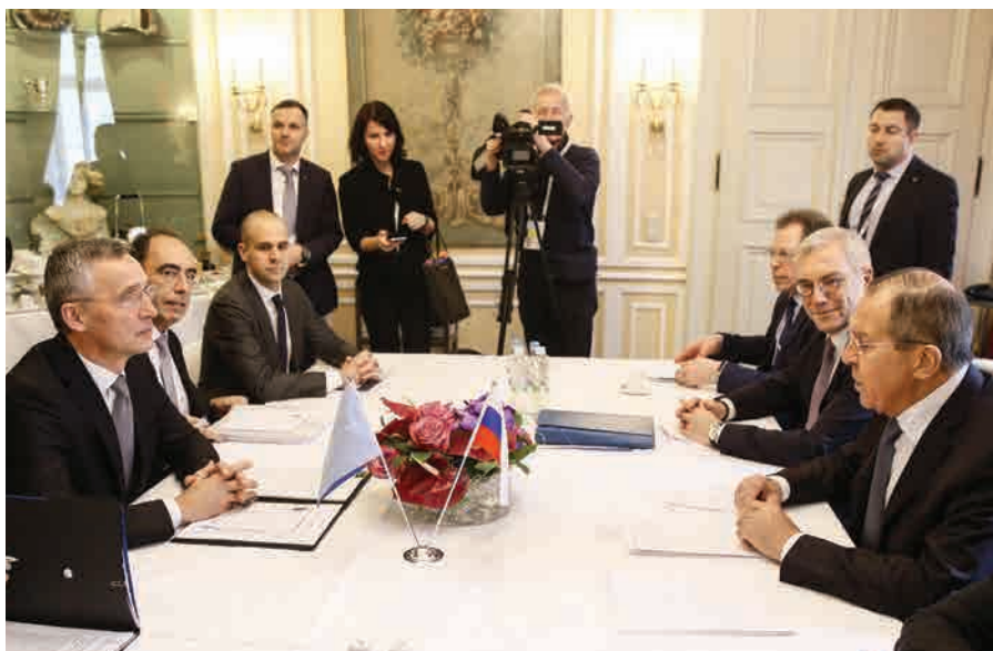
Rusijos ir NATO delegacijų susitikimas Miuncheno saugumo konferencijoje 2018 m.

2017 m. Rusija bandė santykiams su JAV ir Europos valstybėmis suteikti pozityvios dinamikos, o jos politinė vadovybė dažnai laikėsi nuosaikiau nei ankstesniais metais. Tai skatino artėjusių Rusijos prezidento rinkimų ir Rusijoje vykiančio Pasaulio futbolo čempionato veiksniai, prieš kuriuos siekta parodyti daugiau pozityvios dinamikos santykiuose su Vakarais. Kitas motyvas – Rusijos diplomatai santykinai nesėkmingi 2015–2016 m., kurie parodė, kad ligtolinė aiškiai konfrontacinė elgsena daugeliu atvejų nepasiteisino. Nemažai vilčių Rusija siejo su rinkimais JAV, Prancūzijoje ir Vokietijoje, nes tikėjosi Vakarų valstybių laikysenos pokyčių. Pagrindinis Rusijos laikysenos korekcijos tikslas buvo siekis susilpninti sankcijų režimą, didinti įtaką procesams NATO ir Europos Sąjungoje (toliau – ES). Rusija stengėsi sukurti sąlygas atskiroms valstybėms intensyvinti ryšius su Rusija ir taip skatinti bendrų NATO ir ES pozicijų jos atžvilgiu irimą.