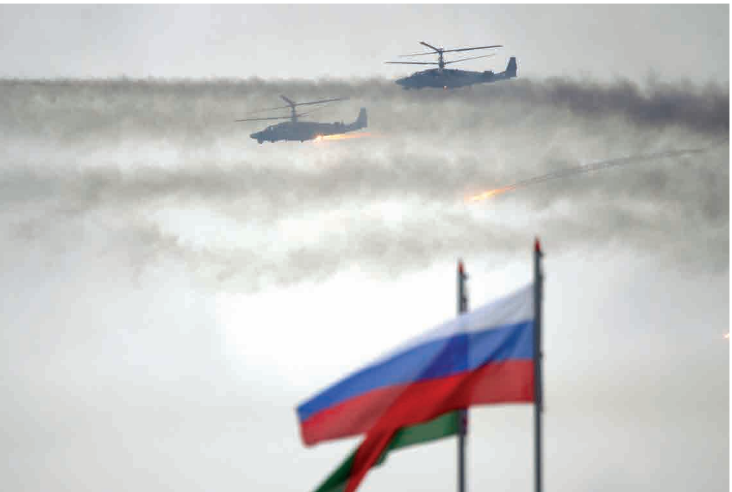
Bendri Rusijos–Baltarusijos mokymai „Zapad 2017“.

Rusija pateikė regiono valstybėms melagingus duomenis apie būsimų mokymų geografinę aprėptį, dalyvių skaičių ir scenarijų. Mokymų mastas ir kompleksiškas rodo, kad buvo vykdomi ne antiteroristiniai mokymai, o tikrinami operaciniai planai prieš Vakarų priešininką. Atskiri pratybių epizodai rodo, kad šiuose planuose yra puolamojo pobūdžio elementų. Puolamojo pobūdžio užduotys buvo vykdomos Baltarusijoje, Kaliningrado srityje ir likusioje Rusijos dalyje.