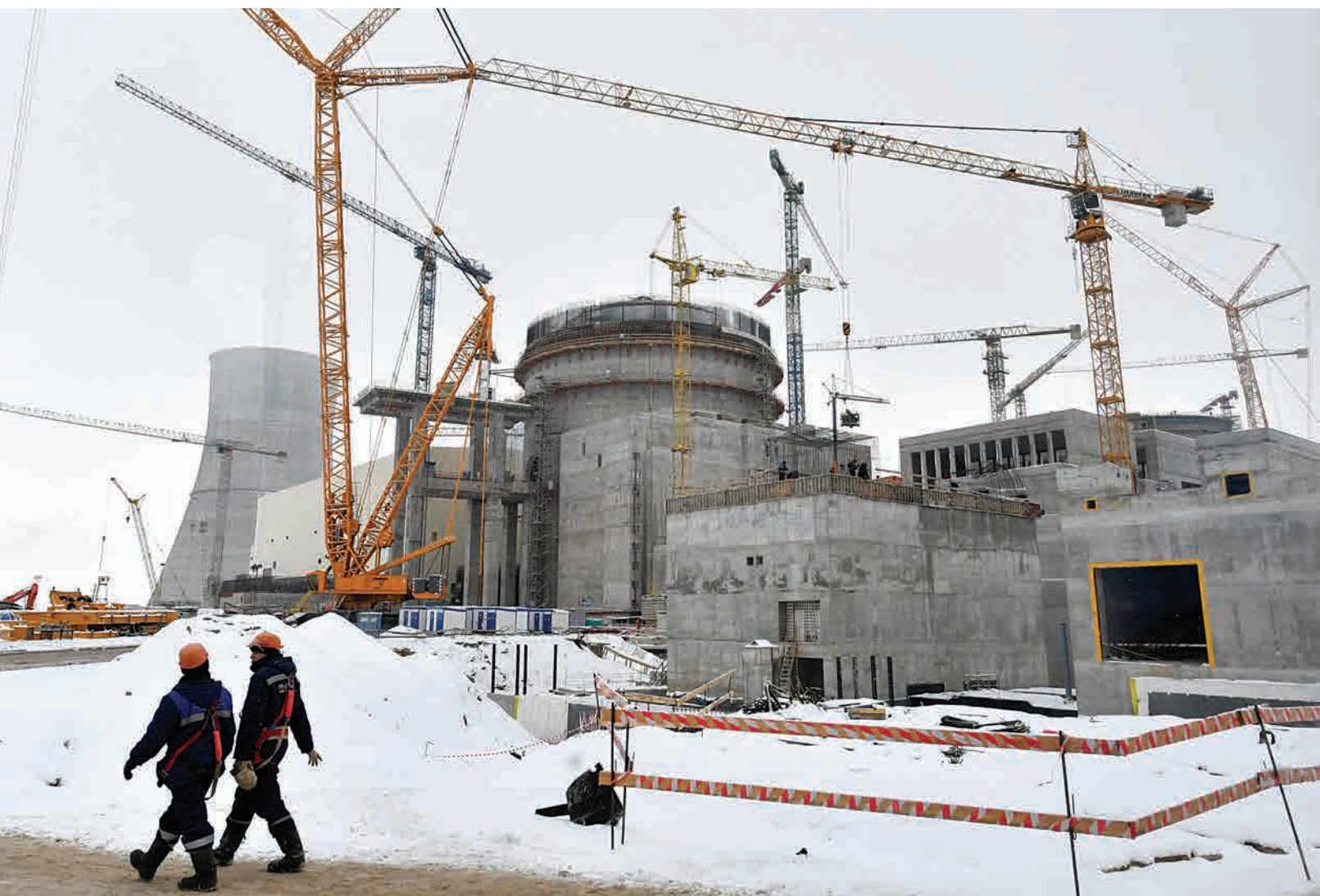
Astravo elektrinės statyba.