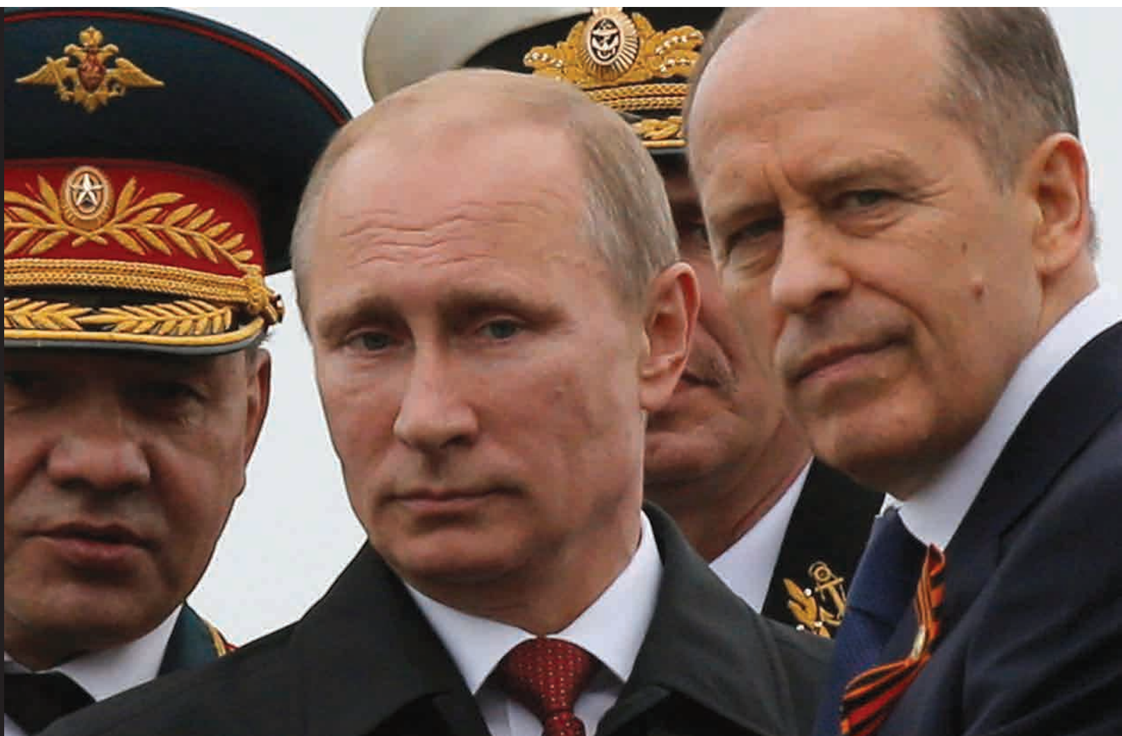
Rusijos prezidentas, gynybos ministras ir FSB direktorius.