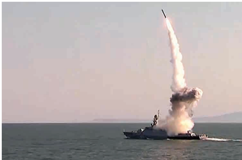
„Kalibr“ sistemos sparnuotosios raketos paleidimas.

2018 m. vasario 5 d. pirmieji „Iskander-M“ kompleksai, keičiantys senesnio modelio raketų sistemas „Točka-U“, atgabenti nuolatiniam dislokavimui į Kaliningrado sritį. Šios raketų sistemos gali naudoti tiek konvencinį, tiek branduolinį užtaisą ir geba naikinti antžeminius taikinius 500 km spinduliu. Jų dislokavimas Kaliningrado srityje išplečia Rusijos galimybes naikinti priešininko karinę ir civilinę kritinę infrastruktūrą, didina atkirtimo ir izoliavimo (toliau – A2 / AD) efektą ir, kilus krizei ar karui, apsunkintų NATO operacijas Baltijos jūros regione.