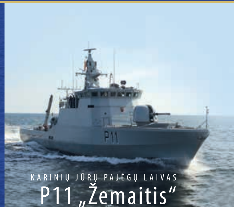
KARINIŲ JŪRŲ PAJĖGŲ LAIVAS P11 „Žemaitis“