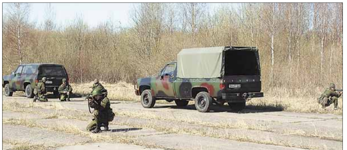
Vyčio rinktinės savanorių pratybos Pajuostyje

Žygio metu turi galimybę geriau pažinti bendražygius, pabendrauti su jais, pasimokyti iš jų patirties. Be galo smagu ir įdomu stebėti, gėrėtis mokėjimu skleisti pasitikėjimą, gebėjimu vadovauti, būti lyderiu. Be galo naudinga turėti vadovą, kuriuo gali pasitikėti. Kuris nesmerkia už klaidas ar nesėkmes, padrąsina eiti pirmyn, paragina imtis iniciatyvos, tvirta ranka griebia už peties, už rankos, kelia į viršų, traukia, stato ant kojų, įkvepia pasitikėjimo, drąsos. Žygio metu vyrąja didžiulis noras prisidėti prie užduočių įvykdymo, koordinacinių nustatymo, tačiau kartais sunku išdrįsti pasakyti savo nuomonę, pasireikšti. Užduotys, kad ir įvykdomos teisingai, tačiau trūkstant praktikos, jų išsprendimo laikas ilgesnis, nei kad kitų karių. Vyrąja baimė suklysti, nukrypti nuo kelio, sukla-