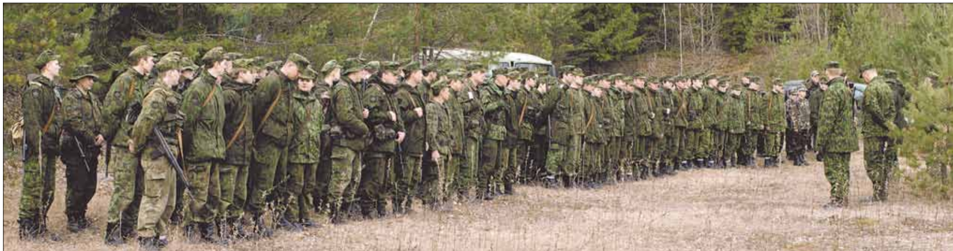
Savanoriai ir Zarasų jaunieji šauliai rikiuojasi Gražutės miške