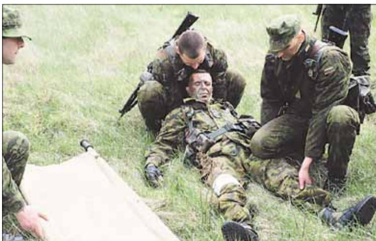
„Sužeistasis“ rengiamas transportavimui

Praėjusių metų pabaigoje, planuojant 2012 metų kovinio rengimo kalendorių, buvo nuspręsta suplanuoti oro paramą, atliekant specifinius kuopos uždavinius ir užduotis ir individualias užduotis. Įvertinus Klaipėdos pajūrio oro sąlygų specifiką ir įvertinus KOP galimybes, pratybos buvo organizuotos Kairių poligone. Kariai treniravosi vykdyti rajono žvalgybą, atlikti infiltraciją, taktiškai vykdyti apsaugą ir įsilaišinimą į sraigtasparnį, vykdyti medicininio evakavimo su sraigtasparniu operacijas pagal griežtai nustatytas KOP specialistų procedūras ir standartus.