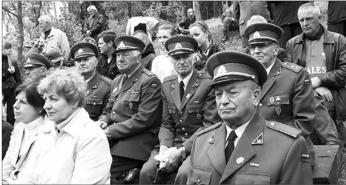
Į Kalniškę atvyko ir grupelė partizanų