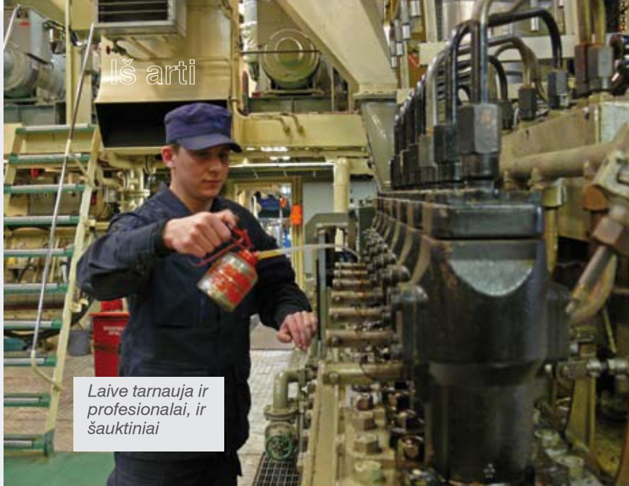
Laive tarnauja ir profesionalai, ir šauktiniai